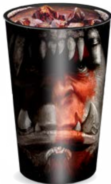
Vaso IML High Gloss