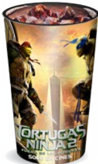
Vaso IML High Gloss