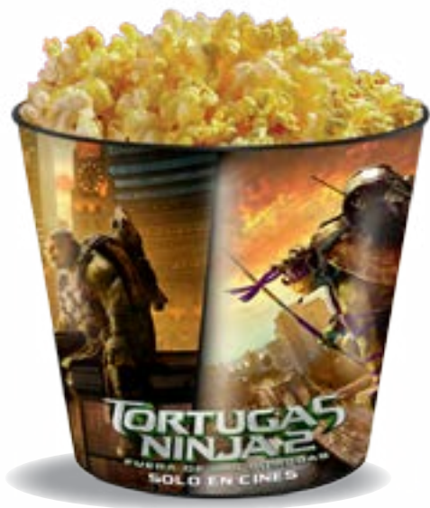
Cubeta IML High Gloss